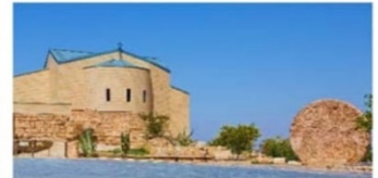
The Moses Memorial Church