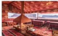
นอนแคมป์

** พักที่ Zawaydeh Camp 4* Hotel หรือเทียบเท่า **