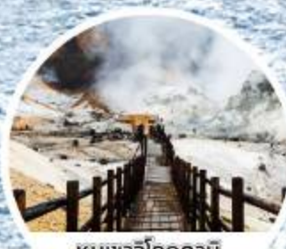
หุบเขาจิกุคุดานิ