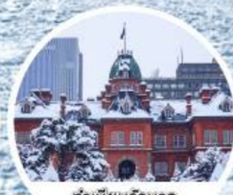
ทำเนียบรัฐบาล