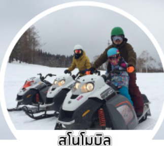
สโนว์โมบิล