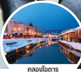
คลองโอตารุ