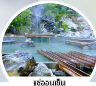
แช่ออนเซ็น