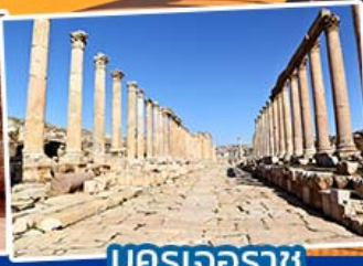
นครเจอราช