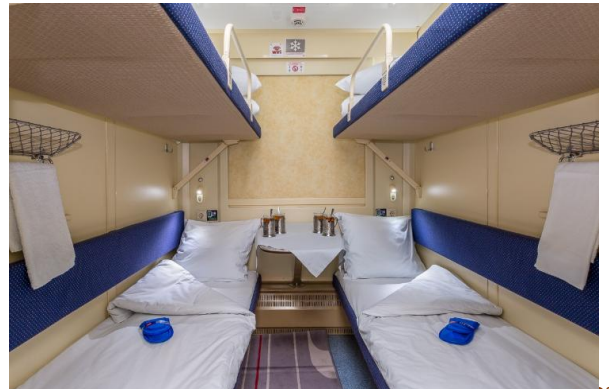
เตียงนอนแบบ 4 เตียงนอน

ข้อมูลที่ควรทราบสำหรับผู้โดยสารรถไฟสายทรานส์ไซบีเรียนบนขบวนรถไฟจะ เปิด HEATER ในโบกี้ และเตียงนอนของผู้โดยสารเฉพาะในฤดูหนาว ห้องผู้โดยสารถูกออกแบบให้เป็นห้องๆ ที่สามารถนอนค้างแรมบนรถไฟได้โดยห้องโดยสารจะถูกแบ่งออกเป็นแบบ เตียงนอนมี 2 เตียงนอน และแบบ เตียงนอนมี 4 เตียงนอน โดยแบ่งเป็น 2 เตียงบนและเตียงล่าง 2 เตียง เตียงนอนชั้นล่างสามารถปรับเป็นเบาะนั่งได้ในช่วงกลางวัน ทั้งนี้หากลูกค้าต้องการพักผ่อนน้อยกว่าจำนวนเตียงที่มีต่อตู้ จะทำให้มีค่าใช้จ่ายเพิ่มเติมในส่วนของเตียงที่ว่างด้วย ภายในเตียงนอนมีพื้นที่เก็บสัมภาระทั้งบนห้อง และใต้ที่นอนมีประตูปิดล็อคห้องจากด้านในเพื่อให้ผู้โดยสารนอนหลับได้ อย่างปลอดภัย อีกทั้งมีโต๊ะที่พับ