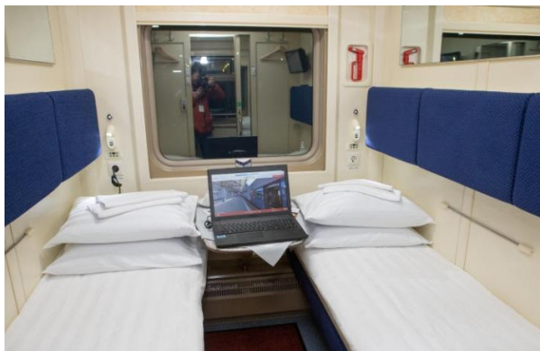
เตียงนอนแบบ 2 เตียงนอน

หมายเหตุ : หลังรับประทานอาหารเช้า แนะนำให้ลูกค้าทุกท่าน เข้าห้องน้ำทำธุระส่วนตัวให้เรียบร้อย รถไฟจะถึง ชายแดนมองโกเลีย - รัสเซีย เวลาประมาณ 21.30 น. และจะใช้เวลาประมาณ 4 ชั่วโมง ในการตรวจเอกสาร เพื่อข้ามแดนระหว่างตรวจเอกสารทุกท่านจะต้องรออยู่ที่ห้อง ไม่สามารถเข้าห้องน้ำได้