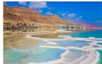
ทะเลเดดซี

** พักที่ Ramada Dead Sea 4* Hotel หรือเทียบเท่า **