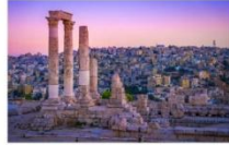
ป้อมปราการแห่งกรุงอัมมาน