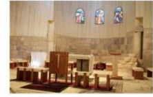
The Moses Memorial Church