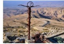
กุเซนาโบ