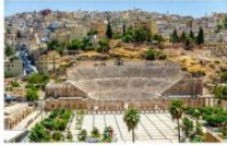
โรงละครโรมัน

04.40 น. เดินทางถึงกรุงอัมมาน ประเทศจอร์แดน