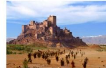
ปราสาทโครแซส