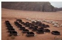
นอนแคมป์