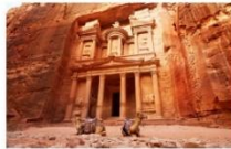
เมืองเพตรา

** พักที่ P4 Quatro 4* Hotel หรือเทียบเท่า **