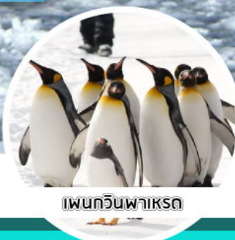
เพนกวินพาร์ค