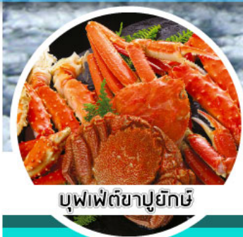
บุฟเฟ่ต์ชาปูยักษ์