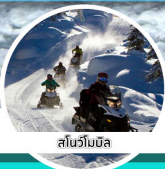
สโนว์บอร์ด