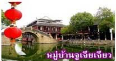
หมู่บ้านจูเจียเจียว