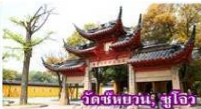
วัดชียนฮวน, ซูโจว