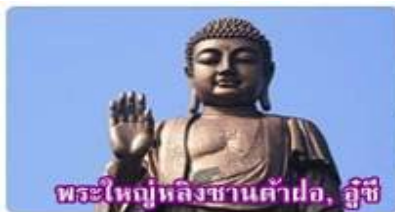
พระใหญ่หลังขานต้าฝอ, อุชิ

✓ เมนูพิเศษ บุฟเฟต์ซีฟู้ด, กุ้งมังกร, กระดุกหมูอุชิ, เสียวหลงเป่า