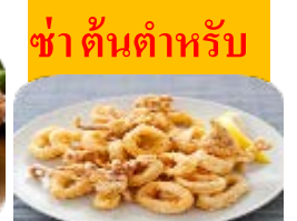
ชา ดั้นตำหรับ