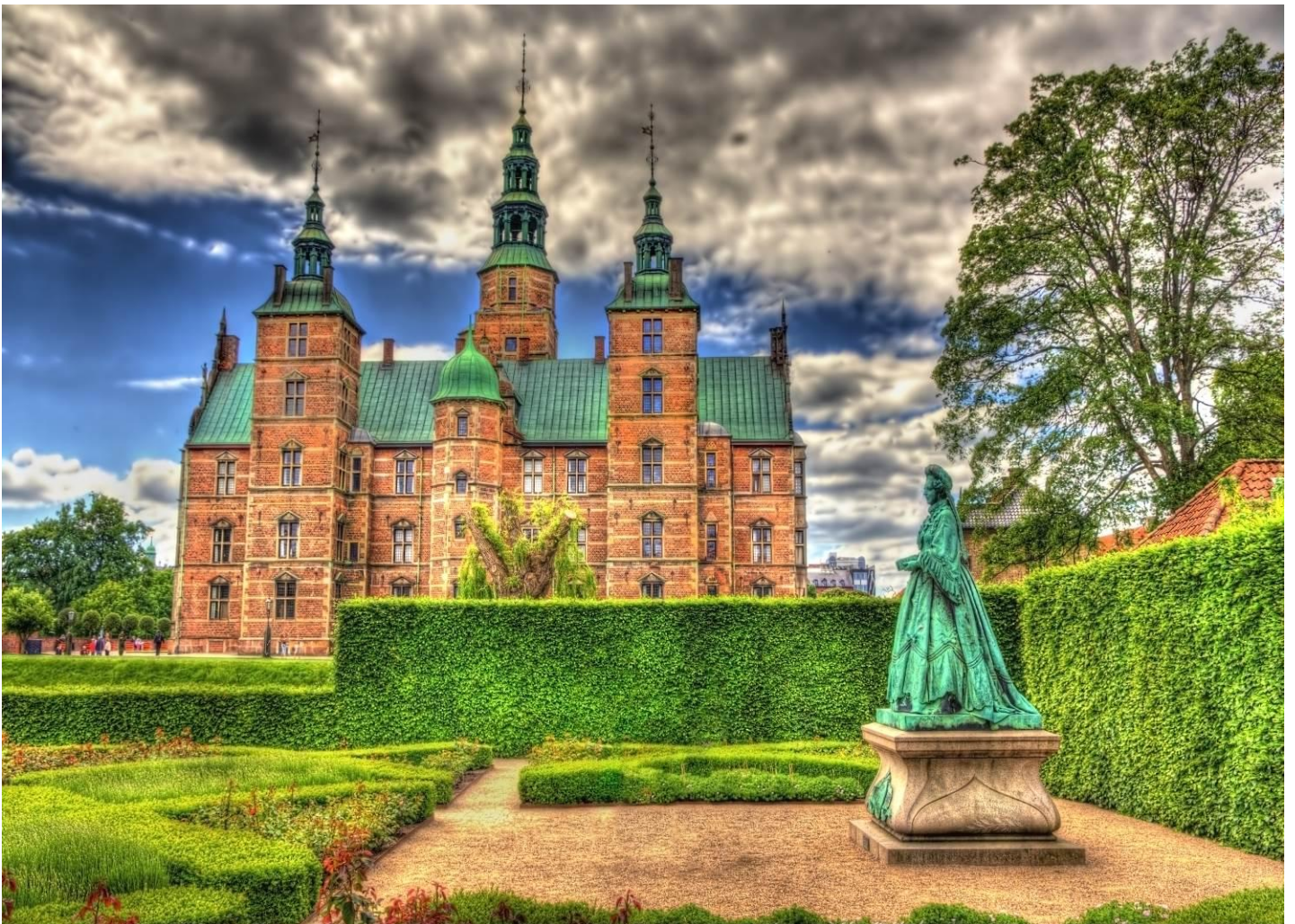
วันที่เจ็ด อิสระท่องเที่ยว หรือ พักผ่อน ที่เมืองโคเปนเฮเกน ตามอัธยาศัย แบบเต็มวัน - ท่าอากาศยานนานาชาติโคเปนเฮเกน เมืองโคเปนเฮเกน ประเทศเดนมาร์ก (B/-/-) เช้า บริการอาหารเช้า ณ ห้องอาหารของโรงแรม

☛ นำคณะเข้าสู่ที่พัก Scandic Hotel Hvidovre, Hvidovre, Denmark หรือเทียบเท่า