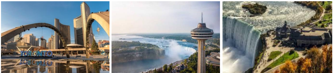
Falls หรือเทียบเท่า (พักห้องเห็นวิวน้ำตกไนแอกการ่า) (B/L/D)

เที่ยง รับประทานอาหารกลางวัน บ่าย นำท่านเดินทางสู่ น้ำตกไนแอกการ่า (ใช้ระยะเวลา ประมาณ 1 ชั่วโมง 20 นาที ) น้ำตกไนแอกการ่าเป็นสิ่งมหัศจรรย์แห่งหนึ่งของธรรมชาติที่สวยงามที่สุดและมีอาณาบริเวณคาบเกี่ยวของ 2 ประเทศ คือ อเมริกาและแคนาดา ระหว่างทางท่านจะได้ ชมทิวทัศน์ที่สวยงามของธรรมชาติและทะเลสาบ "ออนตาริโอ" อันงดงามเมื่อใกล้ถึง เสียงที่ดังกึกก้องมาแต่ไกลบอกให้รู้ว่าได้เดินทางมาถึง น้ำตกไนแอกการ่าแล้ว จากนั้น นำท่านสู่จุดชมวิวน้ำตก Table Rock อันเป็นสถานที่ชมความงามของน้ำตกไนแอกการ่าได้งดงามที่สุด ให้ท่านเพลิดเพลินกับการถ่ายรูป และ ชมวิว น้ำตกได้อย่างทั่วถึง ค่ำ รับประทานอาหารเย็น ณ ภัตตาคารบนหอคอย Skylon ซึ่งเป็น ภัตตาคารกระจกแก้วหมุนรอบ 360° สามารถเห็นวิวในมุม Bird's Eye View นำท่านเข้าสู่ที่พัก Embassy Suite by Hilton Niagara